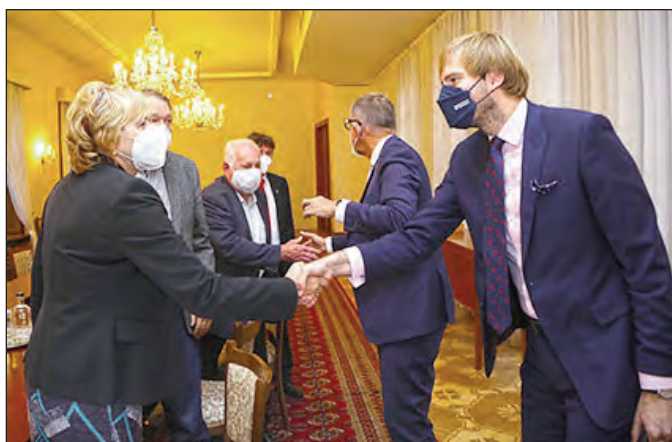
Foto z jednání 4. 10. 2021 Úřad vlády